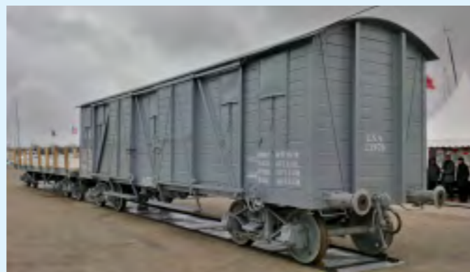
Wagons U.S.A. exposés à la Rochelle en 2017-2018.

De 2015 à 2018, le Cercle a prêté son concours au titre de conseil historique à la restauration d'une rame de six wagons appartenant au corps expéditionnaire américain de la Première Guerre mondiale, afin de reconstituer leur aspect extérieur de 1918. Ces wagons sont classés Monument Historique. Ce projet a été réalisé en partenariat avec le chemin de fer touristique Le Train des Mouettes.