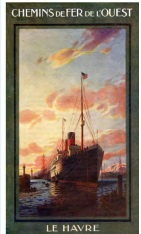
Affiche de la Compagnie de l'Ouest pour le port du Havre

Cette voiture est classée Monument Historique par le Ministère de la Culture depuis le 31 janvier 1991, preuve de son intérêt patrimonial majeur.