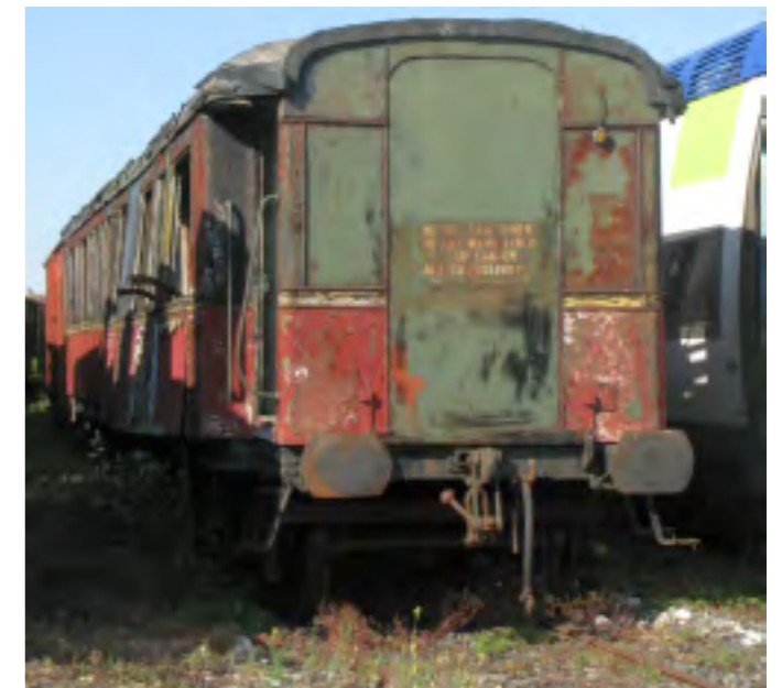
La voiture dans son état actuel