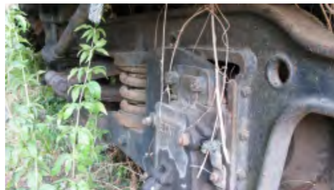
Bogie et boîte d'essieu État