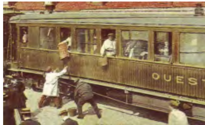
Train transatlantique à Cherbourg

Ces voitures sont les premières à être équipées en France de bogies de type « Pennsylvania » importées des États-Unis. Ils apportent une grande souplesse au roulement.