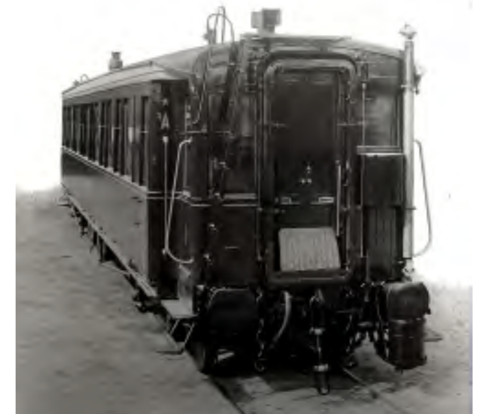
La voiture dans son état d'origine

Enfin, grâce à l'histoire de cette voiture, liée à la tragédie du Titanic , l'intérêt de ce projet dépasse largement les frontières françaises.